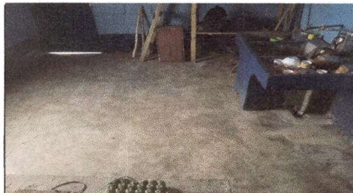
Foto 4: Sustitución de torta de concreto por piso de granito, dentro de la cocina de la escuela.