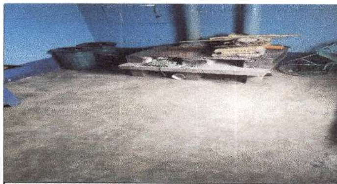
Foto 6: Fotografía 3 donde se puede ver las planchas y chimeneas de la cocina, y la torta de concreto que se cambiará.

Observación: Si es necesario se pueden agregar hojas adicionales y actualizar el número de hojas.