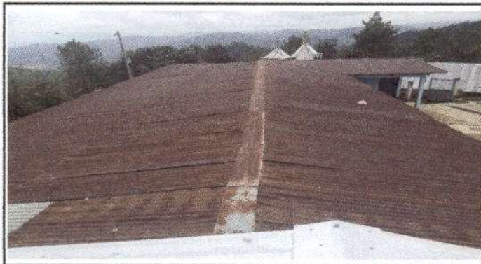
Foto1: Cambio de techo de 3 aulas, incluye 1 bodega y cocina de la escuela.